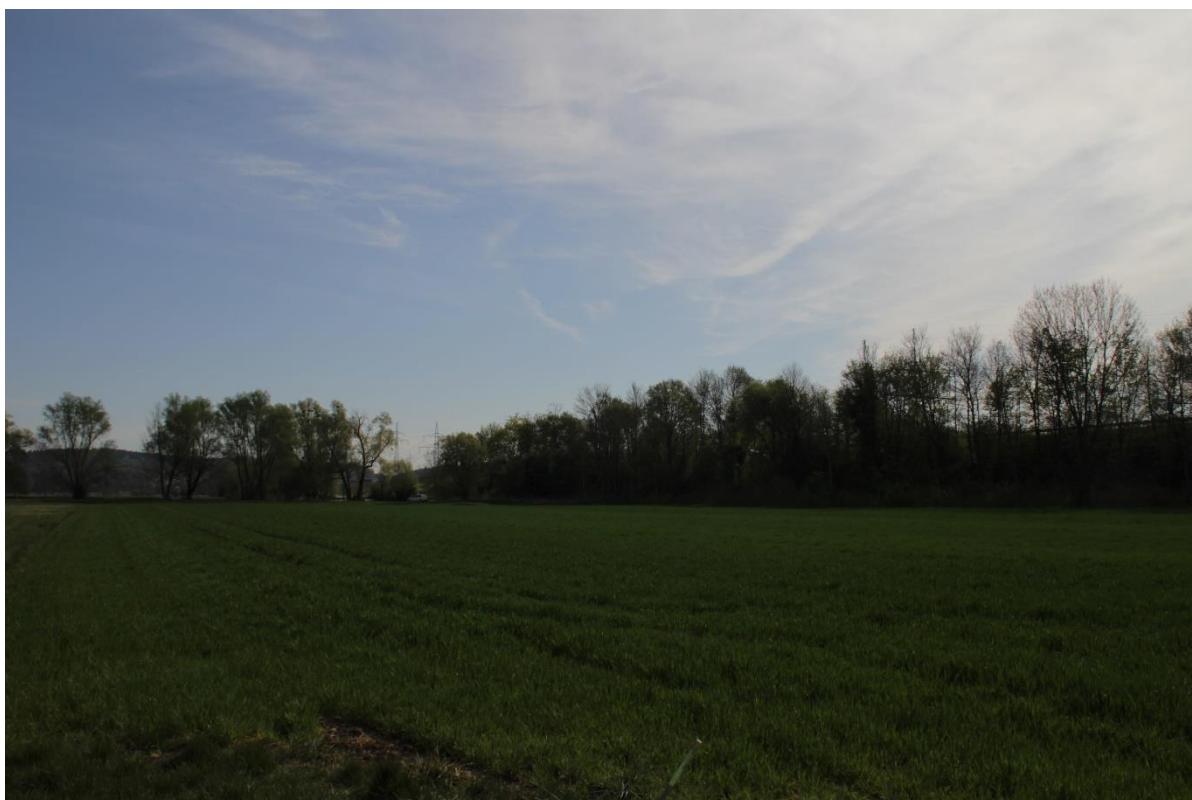
Abbildung 1: Vegetation im Geltungsbereich

Im Geltungsbereich kommt großflächig Acker vor. Nordöstlich und südöstlich befinden sich landwirtschaftlich genutzte Wiesenflächen. Deren Arteninventar setzt sich unter anderem aus Persischem Ehrenpreis ( Veronica persica ), Wiesenschaumkraut ( Cardamine pratense ), Wiesenlabkraut ( Galium mollugo ) Gundermann ( Glechoma herderacea ) und Hirtentäschel ( Capsella bursa-pastoris ) zusammen. Angrenzend an den Geltungsbereich stockt im Bereich des Autobahndamms eine Gehölzhecke aus Spitzahorn ( Acer platanoides ), Roter Hartriegel ( Cornus sanguinea ) sowie einige Weiden. An der Radolfzeller Ach stocken Einzelbäume (Weiden).