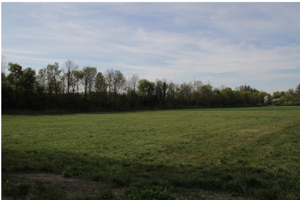
Abbildung 5: Blick vom nördlichen Rand des Plangebietes in Richtung Autobahn A 98