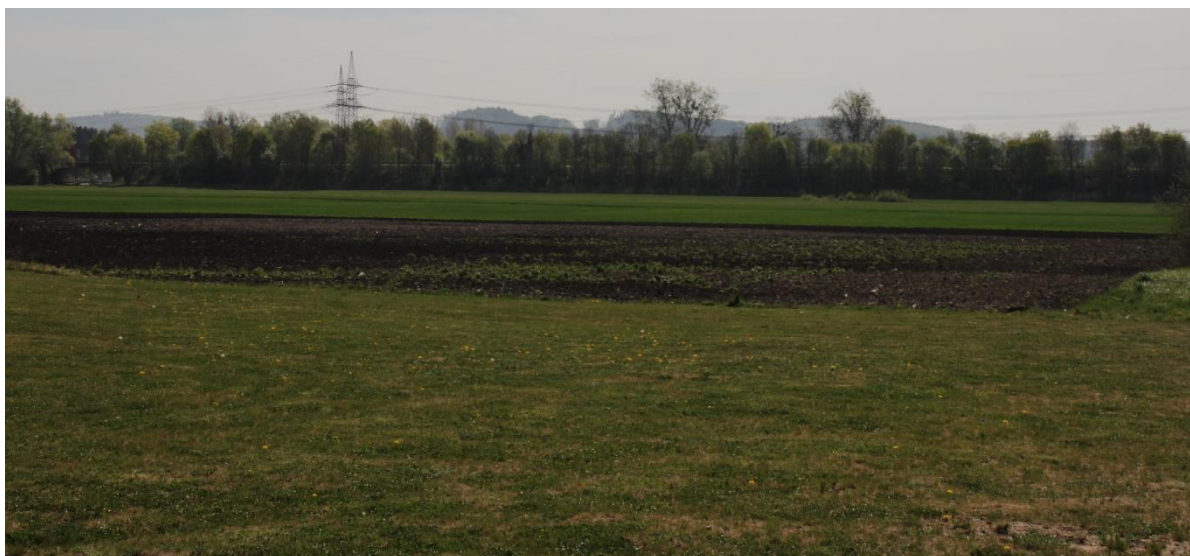
Abbildung 3: Blick auf das Plangebiet Richtung Südosten, im Hintergrund die Dammbepflanzung der Autobahn

Der Geltungsbereich selbst weist keine Gehölzstrukturen auf. Die umgebenden Gehölzsäume und Einzelbäume am Gewässer sowie der heckenartige Bestand entlang des Autobahndamms bieten mit ihren durchgehenden Gehölzbeständen grundsätzlich einen Lebensraum für verschiedene Vogelarten. Es sind hier vor allem Gehölzbrüter, die freie Nester bauen, und Baum-Höhlenbrüter zu erwarten. Höhlenbrüter, wie z.B. der Feldsperling oder Gehölzbrüter wie die Amsel werden nicht gestört oder getötet, da keine Eingriffe in den Gehölzbestand erfolgen.