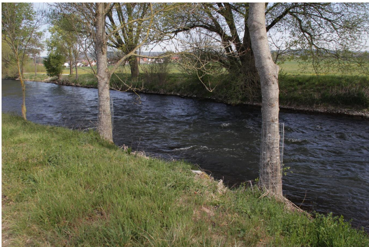
Abbildung 4: begradigtes Flußufer ohne typische Uferstrukturen wie Röhricht und Flachwasserzonen

In der Stellungnahme der UNB wurde explizit auf fehlende Aussagen zum Vorkommen der Feldlerche hingewiesen. Aufgrund der Gehölzstrukturen im Umfeld des Geltungsbereichs ist der Lebensraum für die Feldlerche ungeeignet. Diese hält Mindestabstände von 60-120 m von potenziellen Ansitzwarten ein.