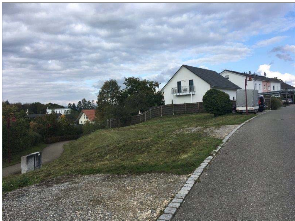
Abbildung 4: Übersicht des Plangebiets, Blick nach Nordwesten