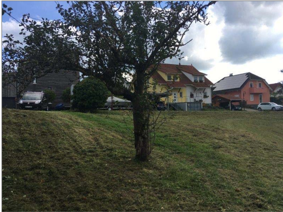
Abbildung 5: Übersicht des Plangebiets, Blick nach Süden