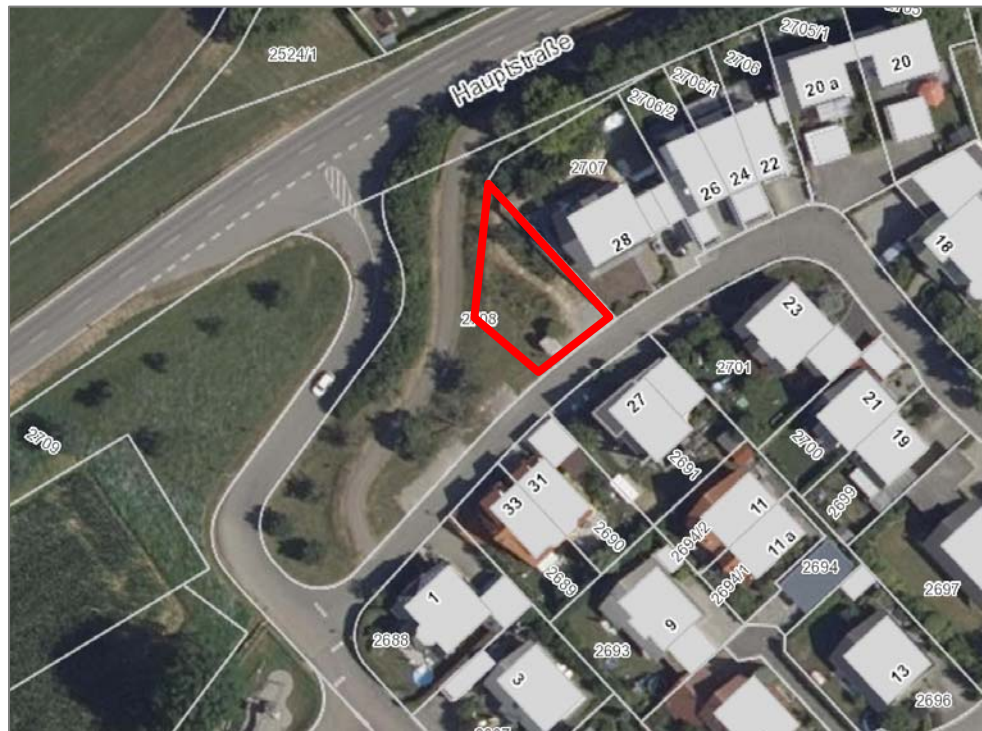
Abbildung 3: Luftbild mit Abgrenzung des Plangebiets (Bildgrundlage: Daten- und Kartendienst der LUBW, 2018)