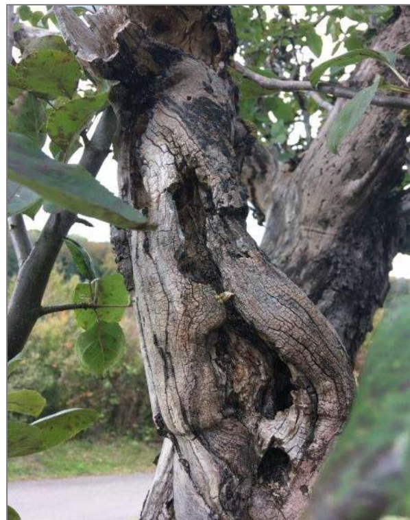
Abbildung 6: Gehölze im Plangebiet: Links Efeubusch, rechts Obstbaum mit Totholzast