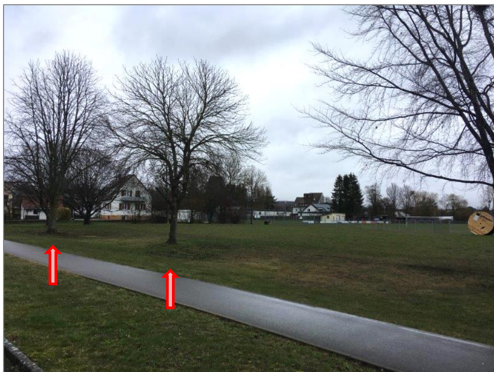
Abbildung 4: Übersicht der Vorhabensfläche mit den beiden Bäumen