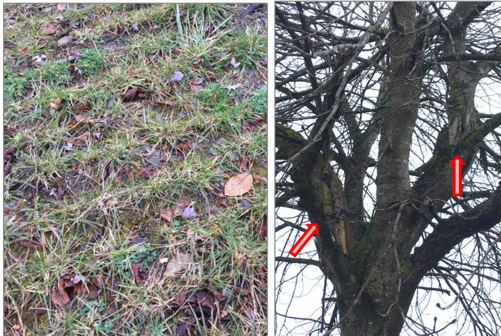
Abbildung 5: Aspekte der Nutzung: Links befahrene Wiese; rechts Baum mit Rindenspalten und Asthöhle