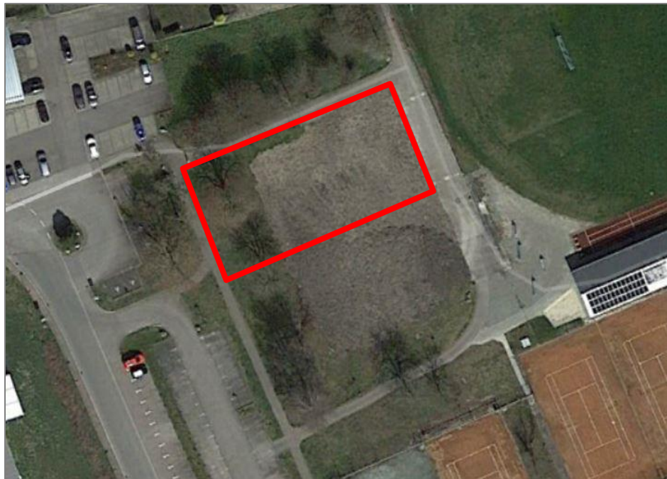
Abbildung 3: Luftbild mit Abgrenzung der Vorhabensfläche