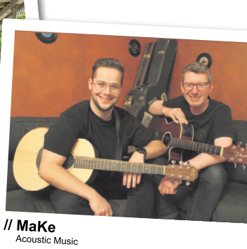
MaKe Acoustic Music