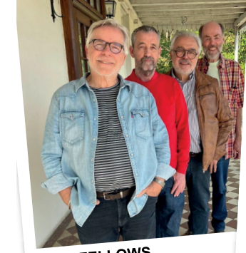
OL' FELLOWS Oldies | Country | Rares