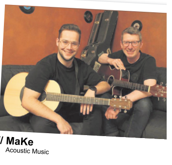
// MaKe Acoustic Music

30. SEPT. 2022 19:00 UHR ALTE KIRCHE VOLKERTSHAUSEN EINTRITT FREI SPENDE ERBETEN