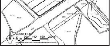
Lageplan des räumlichen Geltungsbereiches des Bebauungsplans